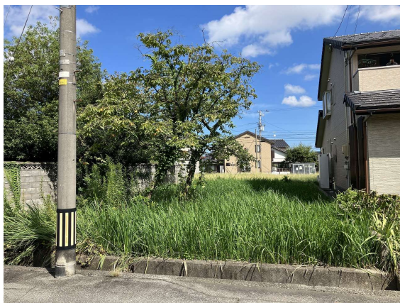
※電柱移設可能です